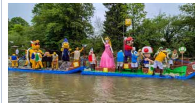
Die Siegerteams des 52. Mammut Flossrennens: Flossclub Wasserflöh & TV Sommeri

Das OK Mammut Flossrennen und die turnenden Vereine Schönenberg-Kradolf